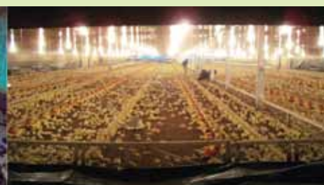
Vista interna de um galpão convencional, do lado direito vista interna de um galpão semi dark house.

ingerido pelas aves. Esses novos galpões denominados pela BOAV de "Semi Dark House" tratam-se de ambientes totalmente controlados por um painel central, que fazem uso de exaustores para renovação do ar, e de bebedouros do tipo nipple disponibilizando uma água de melhor