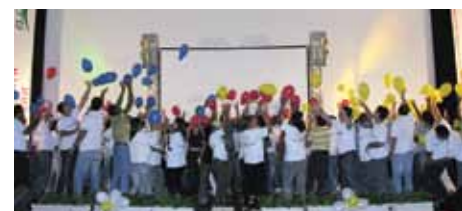
Dinâmica de grupo, segunda-feira

Durante toda a semana, os colaboradores estiveram envolvidos em atividades especiais como: avaliação de desempenho, café da manhã, ginástica laboral, dinâmica de grupo, palestras e teatro, promovendo durante a semana a interação, desenvolvimento e conhecimento a todos os colaboradores BOAV.