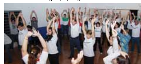
Atividade em grupo, quarta-feira