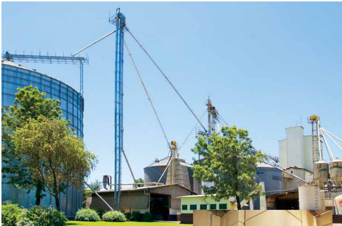
Vista da área externa da Fábrica de Rações